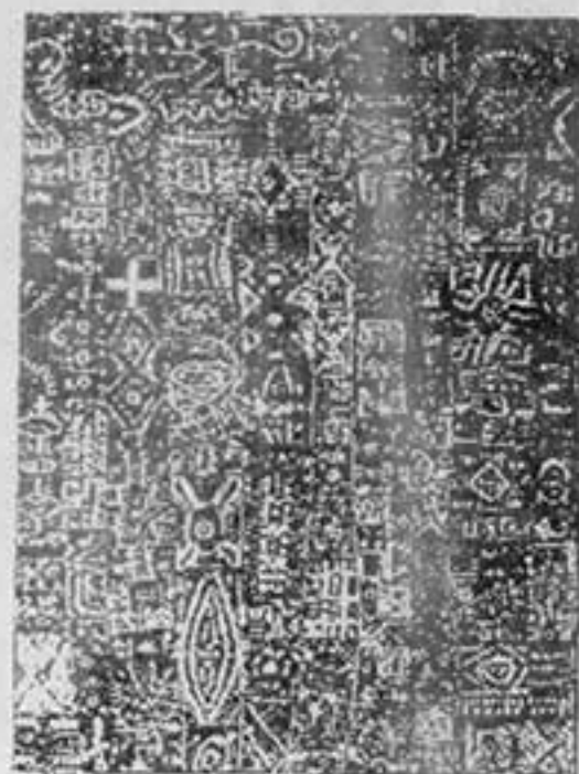
Un panneau en céramique signé Marco Bravura.

Deux rives méditerranéennes lointaines, mais unies par l'Histoire et la civilisation. Marco Bravura qui a exécuté la