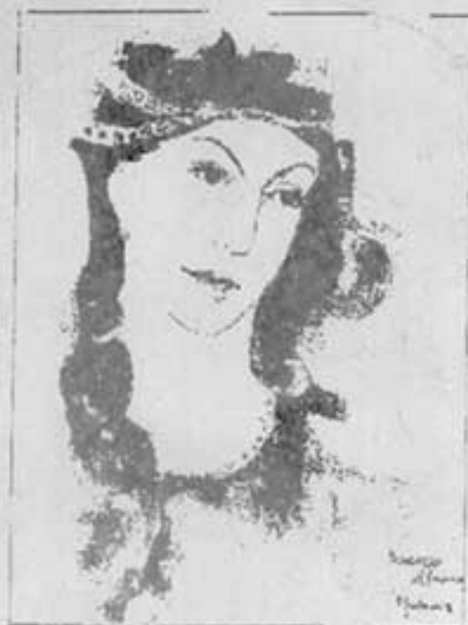
"Le prince", de Renata Venturini.